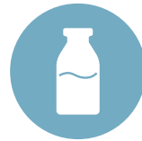
3. Latte Milk