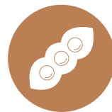
11. Soia Soya