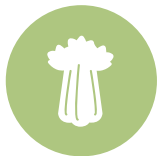
13. Sedano Celery