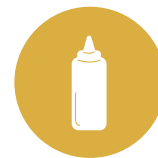
12. Senape Mustard