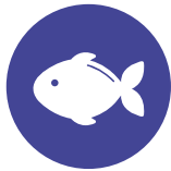
1. Pesce Fish