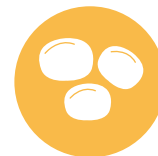
8. Lupini Lupins