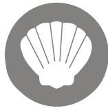
2. Molluschi Molluscs