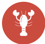
6. Crostacei Shellfish