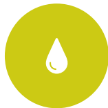
14. Olio di palma Palm oil