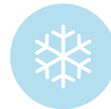
16. Congelato o surgelato Frozen or quick frozen