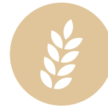
4. Glutine Gluten