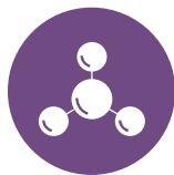
10. Solfiti Sulphites