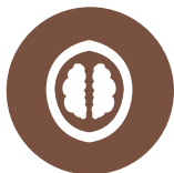
5. Frutta a guscio Nuts