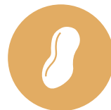
7. Arachidi Peanuts